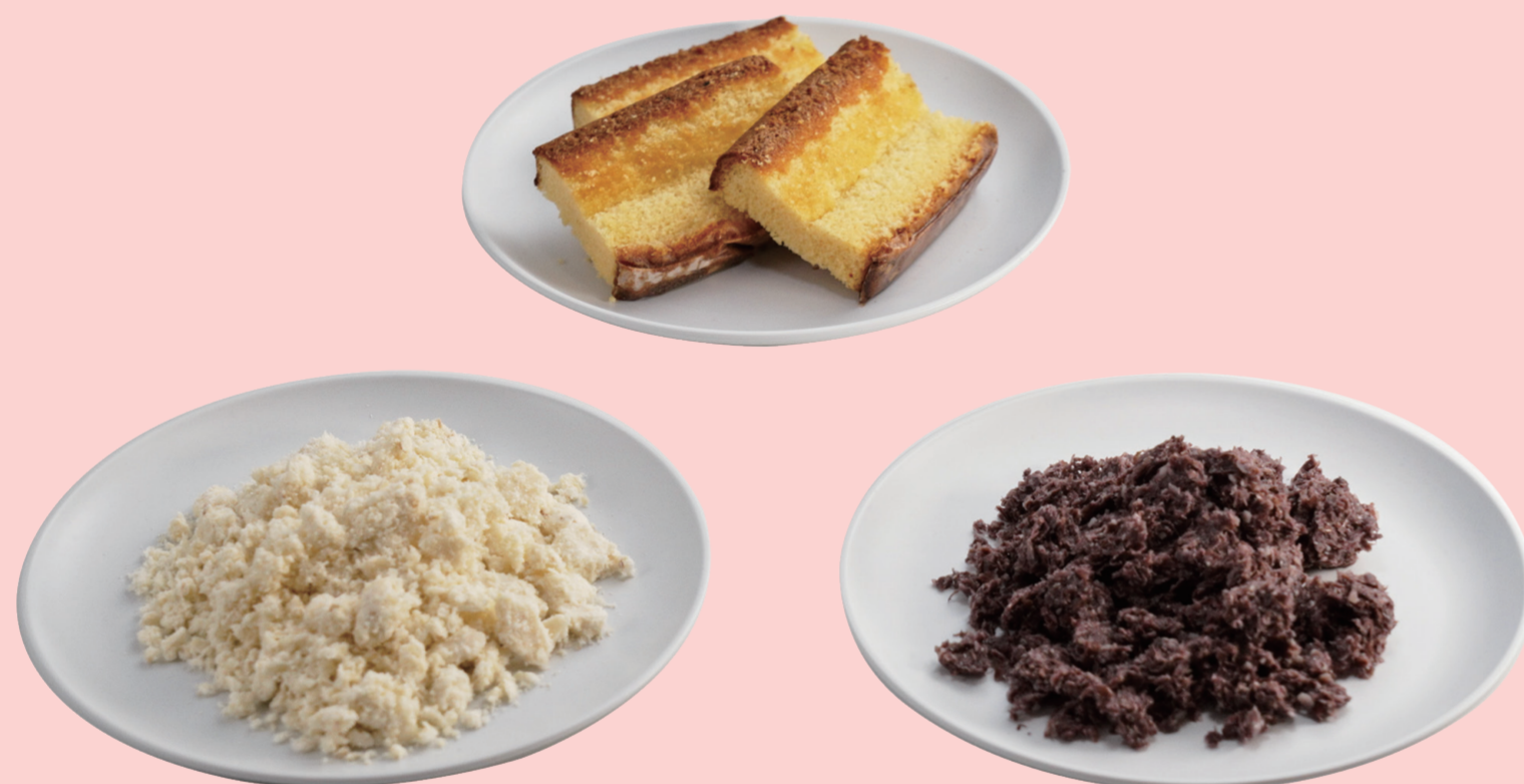
井村屋で発生する副産物の例 (おから、カットカステラの切れ端、あずき副産物)

アップサイクル（創造的再利用）を専門に行い、食品ロスとして発生する“おから”や“あずき副産物”などをパウダー状に加工し有効活用をはかるほか、アップサイクル商品の開発も積極的にすすめています。